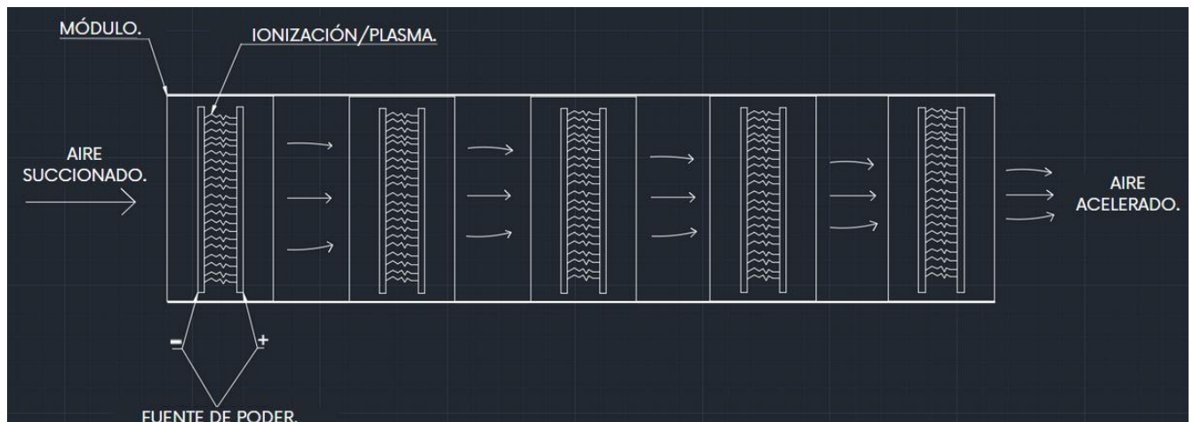
Figura 1.- Esquema de funcionamiento del motor iónico.